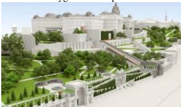
VÁRKERT BAZÁR Budapest