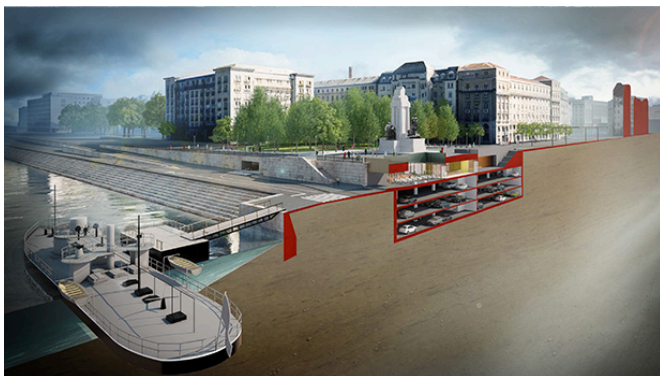
Parlament mélygarázs Budapest