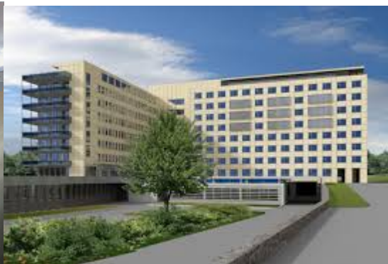
PTE400 ágyas klinika PÉCS