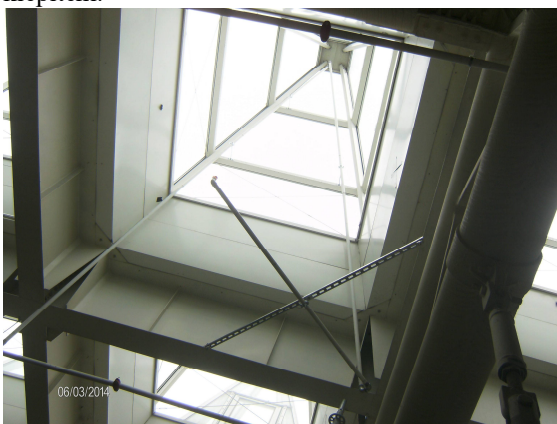
Sprinkler védelem a „tüskékben” 27m magasságban

A tüskecsarnok esetében külön nehézséget jelentett a tetőn elhelyezkedő mintegy 80db „üveg tüskében” speciális hőkioldó elemmel ellátott sprinkler védelmet kiépíteni.