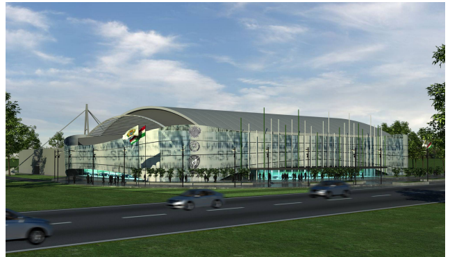
ETO csarnok látványterv

A ETO csarnok esetében az alábbi területeket védtük oltóberendezéssel: