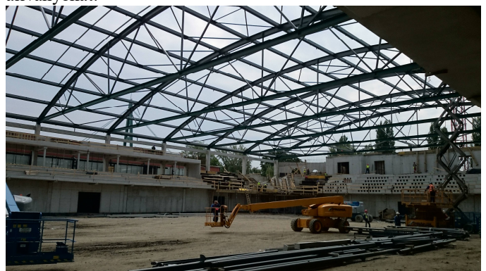
Munkaállványok 24m magasságig

Mindkét project esetén a magasban való munkavégzés szigorú követelményeit követve szereltük meg az oltócsöveket. Megfelelő munkavédelmi koordináció, és alapos műszaki előkészítés mellett 2 műszakban használtuk ezeket a költséges speciális motoros állványokat.