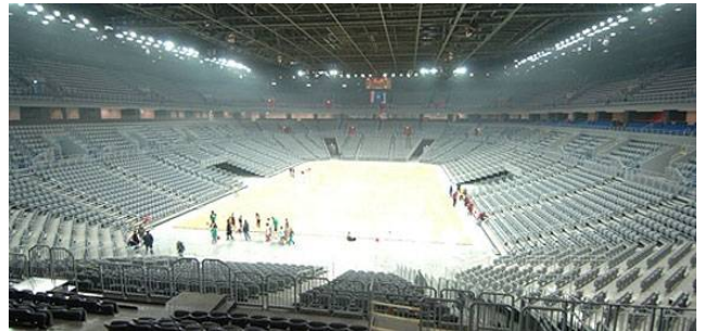
ETO csarnok 20m belmagasság

A másik project Győrben valósult meg, a 2014-es női kézilabda Európa bajnokságra sikeresen határidőre elkészült kézilabda csarnok.